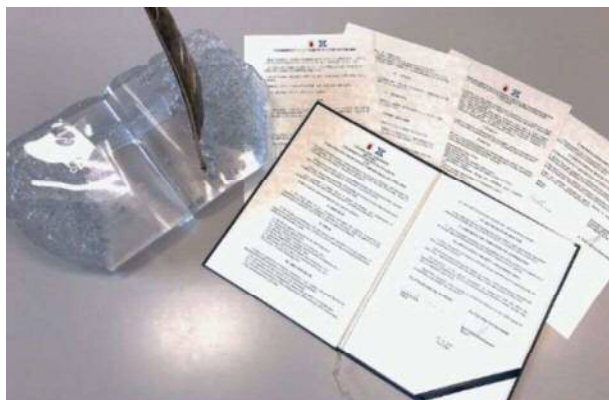
パートナーシティ協定書（英語・日本語・リトアニア語）と協定締結記念